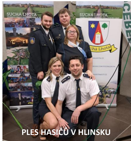
PLES HASIČŮ V HLINSKU