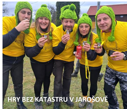
HRY BEZ KATASTRU V JAROŠOVĚ