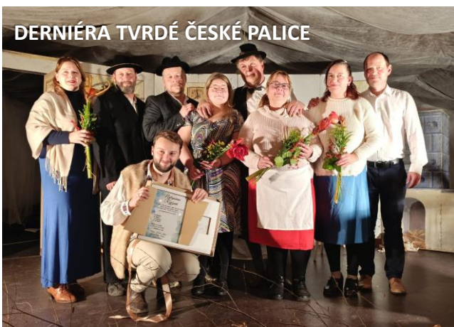
DERNIÉRA TVRDÉ ČESKÉ PALICE