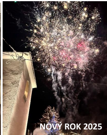
NOVÝ ROK 2025