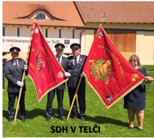
SDH V TELČI