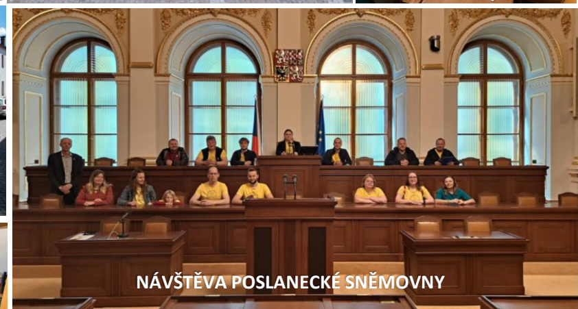
NÁVŠTĚVA POSLANECKÉ SNĚMOVNY