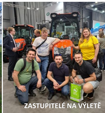
ZASTUPITELÉ NA VÝLETĚ