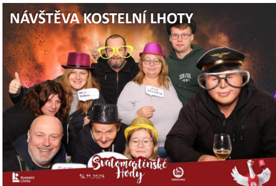
NÁVŠTĚVA KOSTELNÍ LHOTY