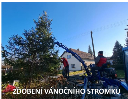
ZDOBENÍ VÁNOČNÍHO STROMKU