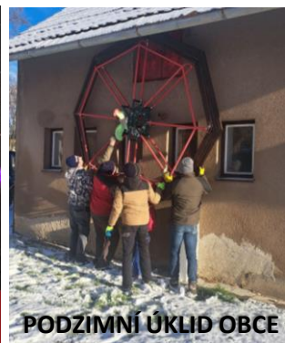
PODZIMNÍ ÚKLID OBCE