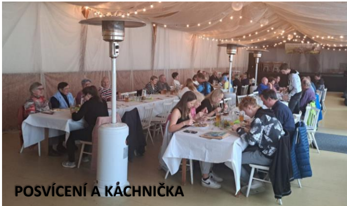
POSVÍCENÍ A KÁCHNIČKA