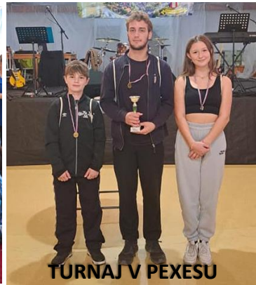
TURNAJ V PEXESU