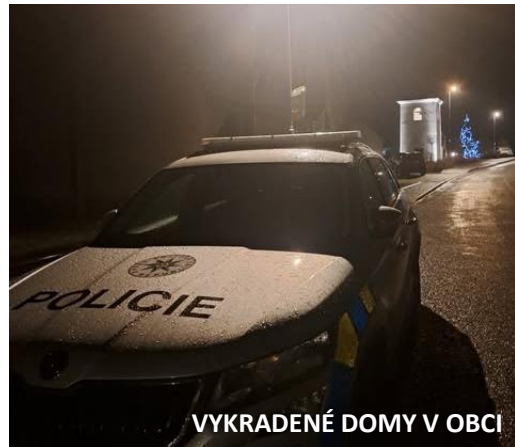
VYKRADENÉ DOMY V OBCI