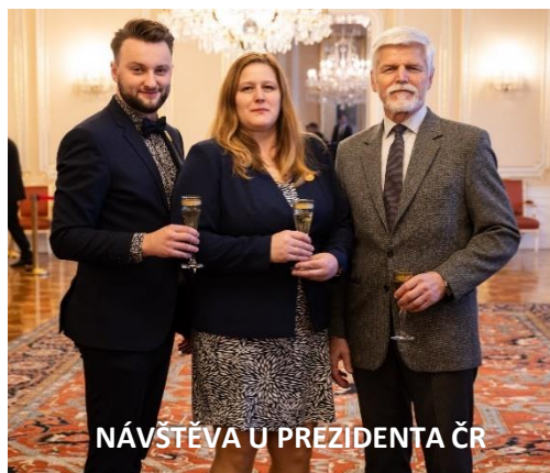
NÁVŠTĚVA U PREZIDENTA ČR