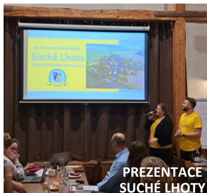
PREZENTACE SUCHÉ LHOTY