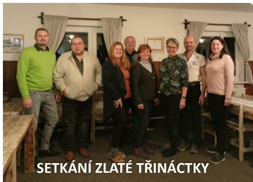
SETKÁNÍ ZLATÉ TŘINÁCTKY