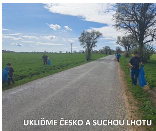
UKLIĎME ČESKO A SUCHOU LHOTU