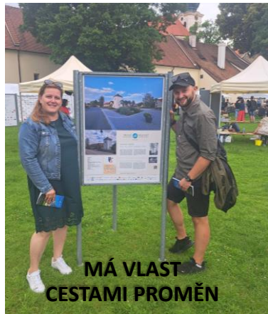
MÁ VLAST CESTAMI PROMĚN