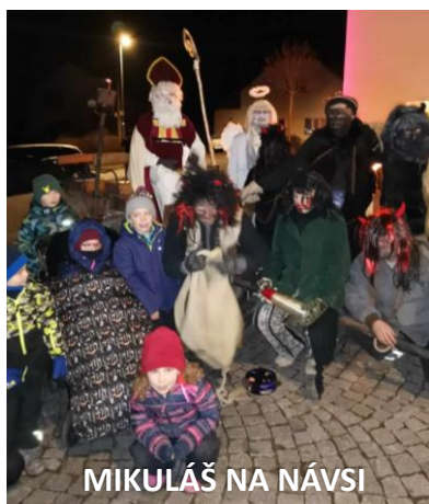
MIKULÁŠ NA NÁVSI